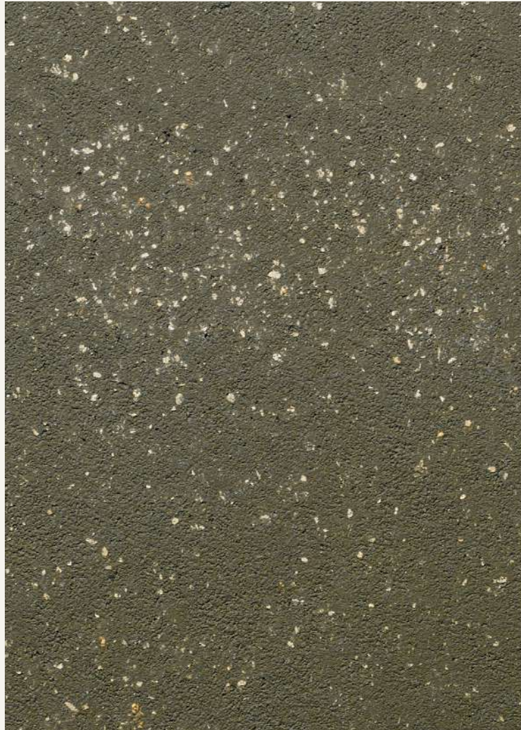
ARCHI+ PIETRA 19036 & CERA WAX PLUS