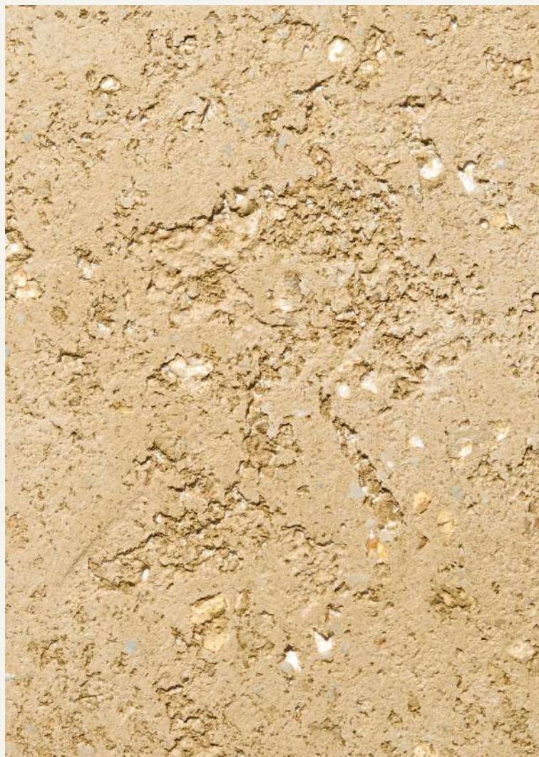
ARCHI+ PIETRA INTONACO BIANCO & PATINA MINERALE NEUTRA & PATINA MINERALE 6202