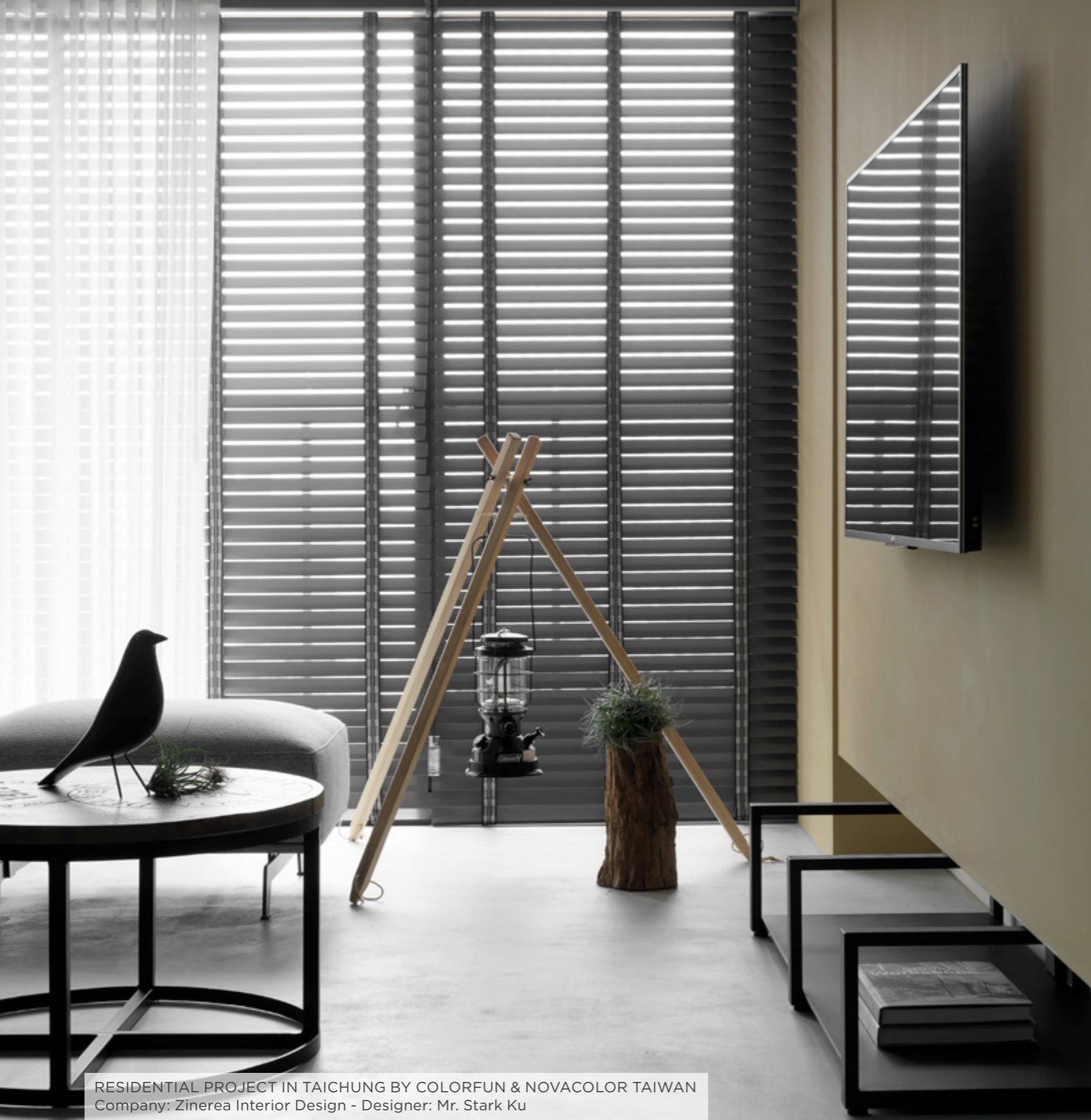
RESIDENTIAL PROJECT IN TAICHUNG BY COLORFUN & NOVACOLOR TAIWAN Company: Zinerea Interior Design - Designer: Mr. Stark Ku