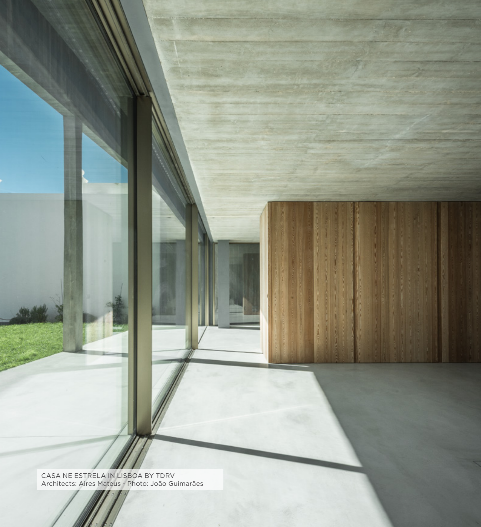
CASA NE ESTRELA IN LISBOA BY TDRV Architects: Aires Mateus